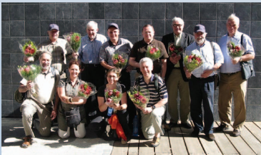
INLEEFREIS ZUID-AFRIKA, 2008

Ex-Change Company Club, een ondernemersnetwerk dat anders naar de wereld kijkt